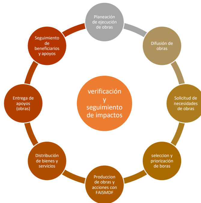
FIGURA 1. MODELO GENERAL DE PROCESOS SEGUIDOS

En consecuencia a lo anterior, el grado de consolidación operativa del FAISMUN, permite reconocer que 1) si existen documentos que normen los procesos del FAISMUN; 2) los operadores de los procesos están documentados respecto a la aplicabilidad del FAISMUN en obras –obras públicas municipales-; 3) los procesos están estandarizados respecto a la planeación de obras; 4) se cuenta con un sistema de monitoreo e indicadores de gestión que retroalimenten los procesos operativos por medio de sistemas de información aplicativos; 5) se cuenta con mecanismos para la implementación sistemática de mejoras. Por lo anterior, consolidación operativa del FAISMUN es de menor alcance comparado con el FAISMUN como otra fuente de financiamiento de obras para el Municipio y población objetivo identificable.